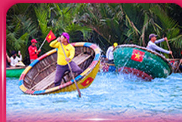
ล่องเรือกระดัง หมู่บ้านกิมทาน