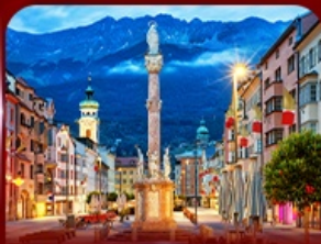
เที่ยวย่านเมืองเก่า วินส์บูร์ก