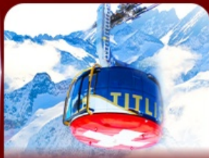
*Optional* นั่งกระเช้าชมวิวทิวทัศน์