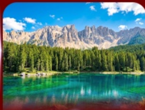
ชมวิวโดโลไมท์ ทะเลสาบคาเรซา