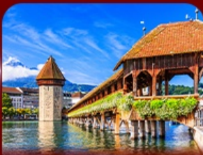
สะพานไม้อาเปลา ลูซิริน