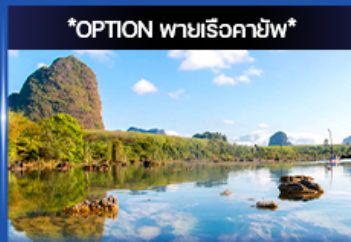
คลองหurut (คลองน้ำใส)