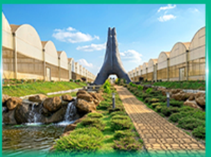
Agro Vege Farm