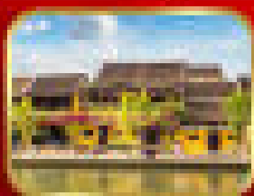
เหือวบานกอลบ (ตามั้)