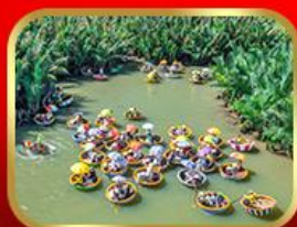
ล่องเรือกระดิ่งกั๊กทาน