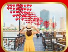
เช็กอินสะพานแห่งความรัก