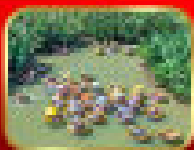
เหือวบานกอลบ (ตามั้)