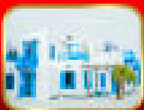
เหือวบานกอลบ (ตามั้)