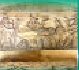
ภาพวาดผนังโบราณ