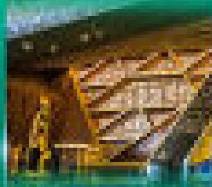
พีระมิดแห่งกิซา (Giza)