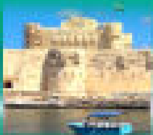
Downing Nile by