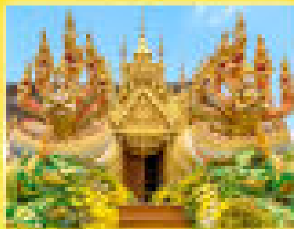
วัดมณีโชติ นรมายก