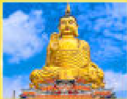
พระพุทธรูปทองคำในลำปาง