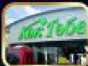
Palace of Independence

เน้นทะเลสาบซิมบูลัค-ทะเลสาบชาร์น-ฮาร์น-ฮาร์น