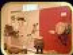
Museum of Folk Instruments