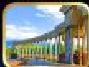
Tajik Presidential Park