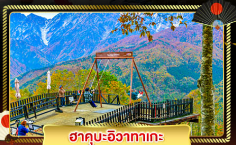
ฮาคุบะอิซากาตะ