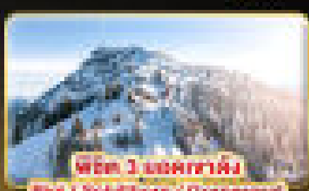
ที่พัก 1 คืนเซอร์แมท

Golden Pass (Lucerne Interlaken Express / Chamonix)