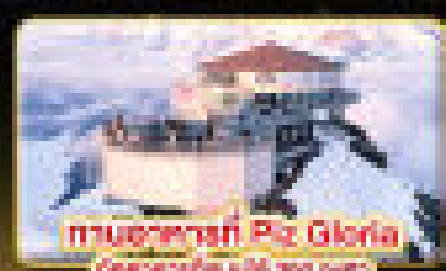
ทานอาหารที่ Pic Gloria