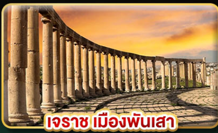
เระชา เมืองพันเสา