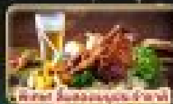
ดื่ม & ดินเนอร์ 5 ดาว ใน 3 ประเทศ