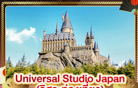
Universal Studio Japan (อิสระท่องเที่ยว)