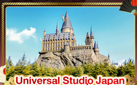
Universal Studio Japan (อิสระท่องเที่ยว)