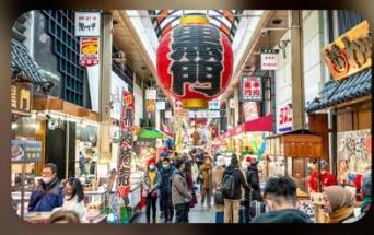
ตลาดปลาคูโรมง