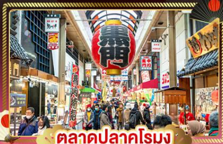
ตลาดปลาคุโรมง