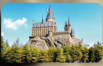
Universal Studio Japan อิสระท่องเที่ยว