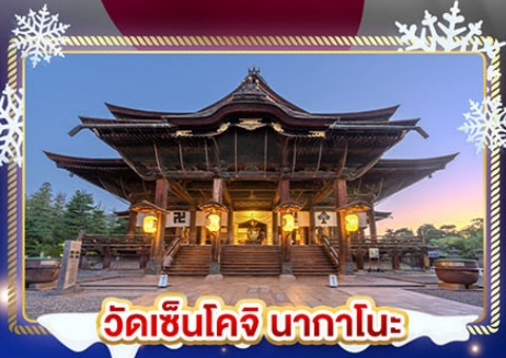
วัดเซ็นโคจิ นากาโนะ