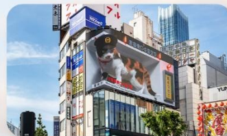
ซูปป์ิงชินจูกุ