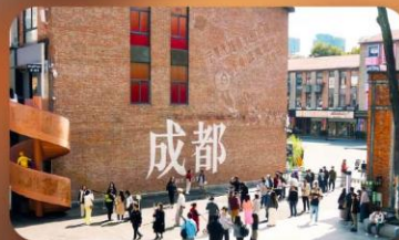
ตงเจียวจี้จี้