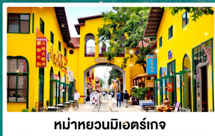
หมู่บ้านมิตร์เกจ