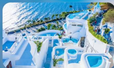
ซาโตรินี่