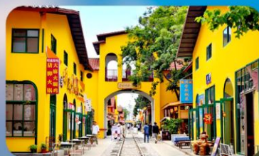
หมาหยวนมิเอตร์เกจ