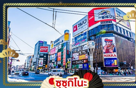
ซูซุกิโนะ