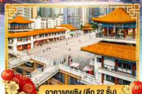
อาคารกุยซิง (ตึก 22 ชั้น)