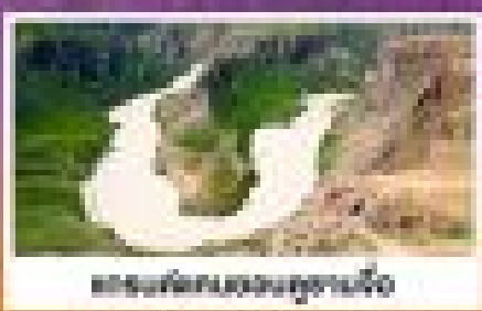
ถนนคดเคี้ยวบนภูเขาหิมะ