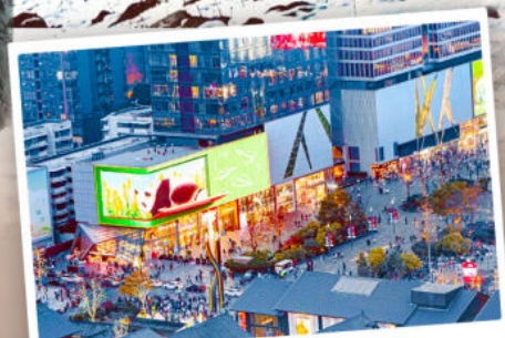
ถนนไท่กู่หลี่หลิน