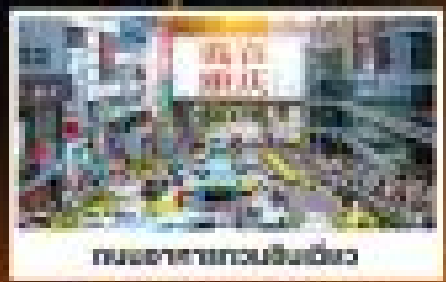
ถนนสายถนนฮวงหนิง