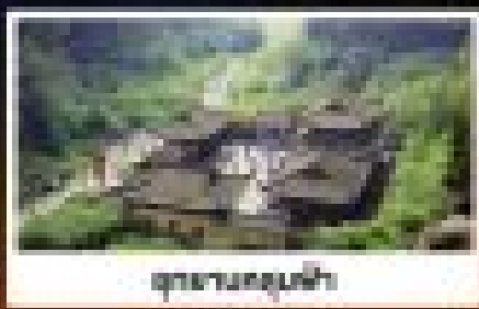
อุทยานหลุมฝังศพ