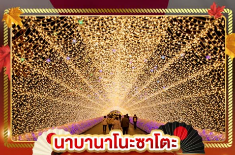
นาราในะซาโตะ