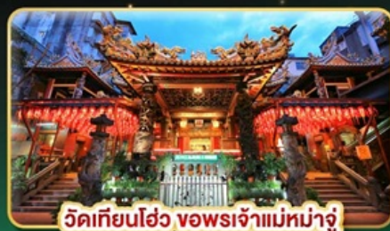
วัดเทียนโฮ่ว ของพระเจ้าแม่หม่าจู