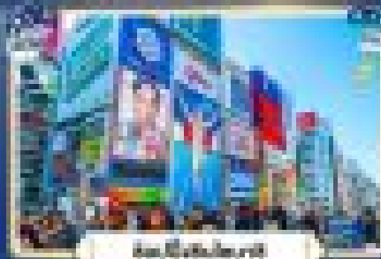
ถนนชิเทนโบชิ