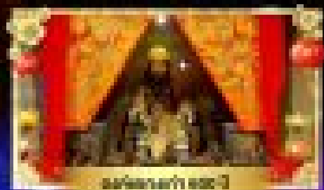
สวนสนุกดิสนีย์แลนด์