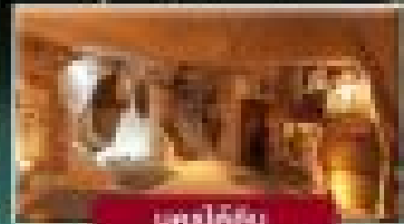
เพลงคัสม