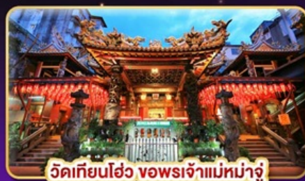
วัดเทียนฮั่ว ของพระเจ้าแม่หม่าจู