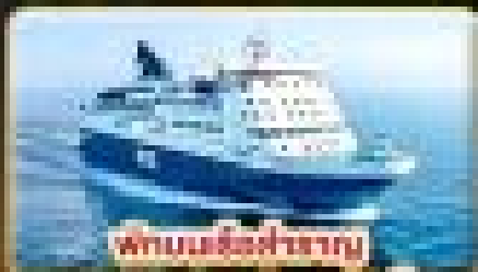
พินนังเรือสำราญ

สัมผัสความเป็นที่ที่สุดของ สแกนดิเนเวีย ให้ท่านได้พักผ่อนแบบ SLOW LIFE