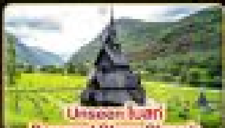
Unseen Swan Borgund Slave Church