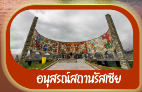
อนุสรณ์สถานรัสเซีย