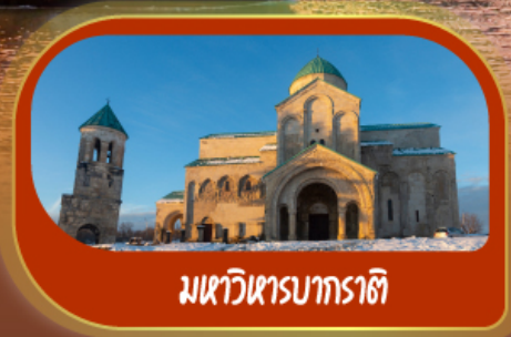
มหาวิหารบาราติ