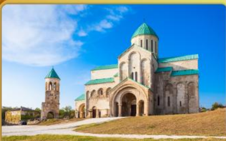
มหาวิหารบากราติ