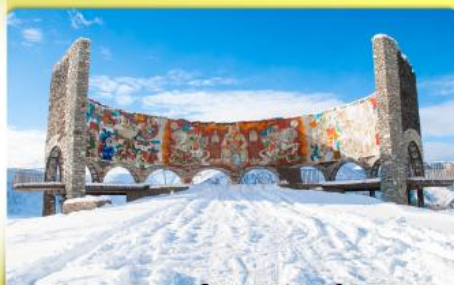
อนุสรณ์สถานรัสเซีย