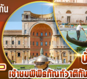
เข้าชมพิพิธภัณฑท์วาติกัน