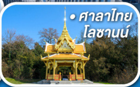
• ศาลาไทย โลซานน์

• สุดอากาศดีดีที่ซอร์แมก • ขึ้นกระเช้าสู่ยอดจากกลาเซียร์ 3000 • ชมเมืองคลาสสิกเบิร์น ลูเซิร์น ซูริค