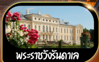
พระราชวังรัตนดาค