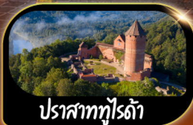
ปราสาทตุร์ถึ

GO3HEL-EK001 28 ธ.ค.69 - 07 ม.ค.70 เทศกาลปีใหม่