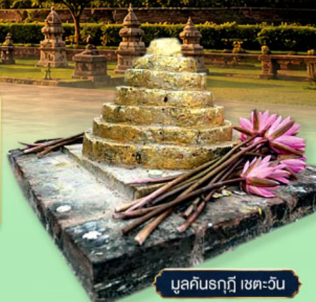
มุลคันรฤฎี เขตตะวัน