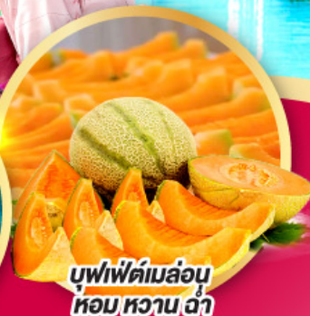
บุฟเฟ่ต์เมล่อน หอมหวาน ฉ่ำ