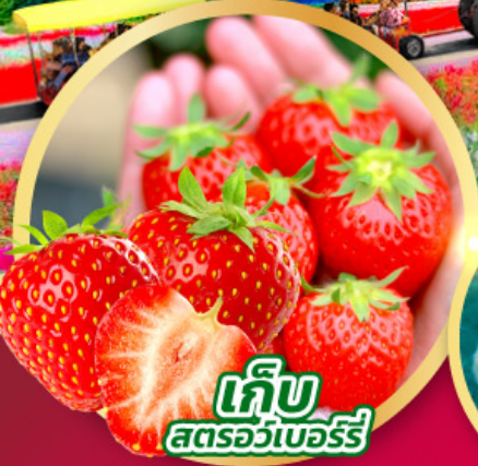
เก็บ สตอร์วเบอร์รี่