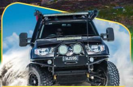
ขึ้นรถ 4WD สู่ใจกลางเทือกเขาคอเคซัส