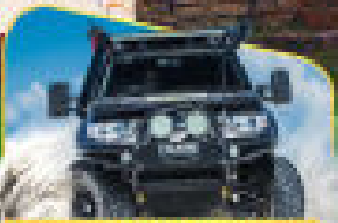
โบนก 4WD สู้รถทางเทืองพาดทะเล