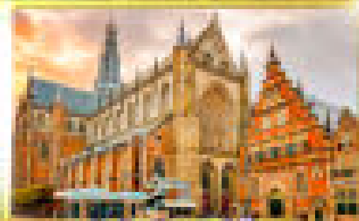
จัตุรัสเมืองฮาร์ลัม

การชมเมืองลักเซมเบิร์ก ชมเมืองกลอกท์ เมืองฮาร์ลัม เมืองชรีเจนในลักเซมเบิร์ก