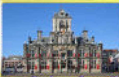
อาคารเมืองท่า การลงเมืองกลอกท์