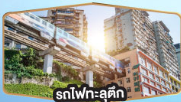
รถไฟฟ้าชุนชิ่ง