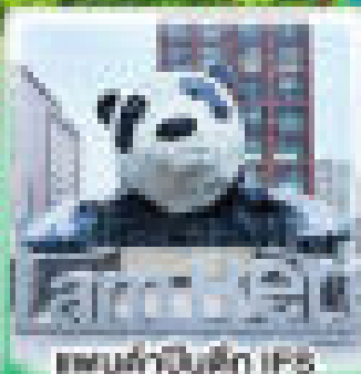
สวนสัตว์ป่านัก IPS