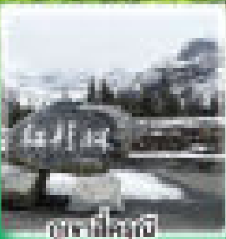
อุทยานสิครุณี