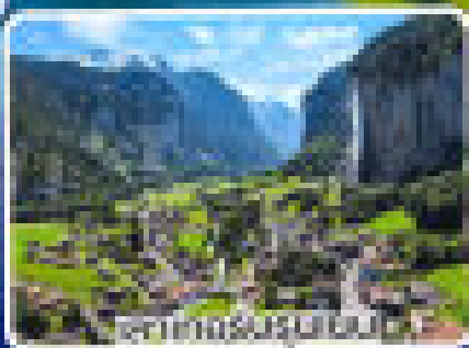
ทะเลสาบสวิส