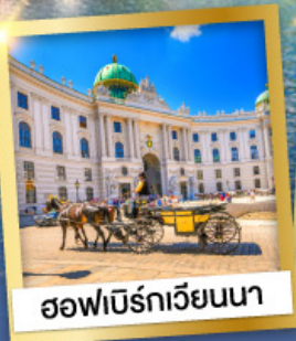
ออฟเบิร์ทเวียนนา