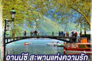
อานนชี สะพานแห่งความรัก