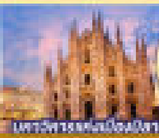
ชมวิหารหลวงเมืองนินจา