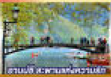
ชมทะเลสาบและเทือกเขามงบล็อง