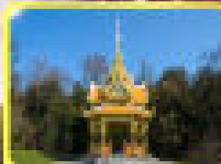
ศาลาภิรมย์ไพศาล