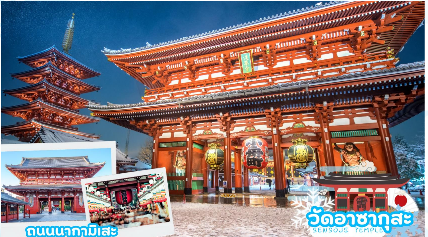
ถนนนากามิसे

นำท่านเดินทางสู่ วัดอาซากุสะ (Asakusa) วัดที่เก่าแก่ที่สุดในกรุงโตเกียว ขอพรจากพระพุทธรูปเจ้าแม่กวนอิมทองคำ ท่านยังจะได้เก็บภาพประทับใจกับโคมไฟขนาดยักษ์ที่มีความสูงถึง 4.5 เมตร ซึ่งแขวนอยู่บริเวณประตูทางเข้าวัด และยังสามารถเลือกซื้อเครื่องรางของขลังได้ภายในวัด ฯลฯ หรือเพลิดเพลินกับ ถนนนากามิसे ถนนช้อปปิ้งที่มีชื่อเสียงของวัด มีร้านขายของที่ระลึกมากมายไม่ว่าจะเป็นเครื่องรางของขลัง ของเล่นโบราณและตบท้ายด้วยร้านขายขนมที่คนญี่ปุ่นชื่นชอบ แม้กระทั่งองค์จักรพรรดิองค์ปัจจุบันยังเคยเสด็จที่วัดแห่งนี้