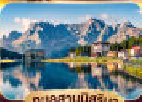
เทือกเขานีลส์ริมา