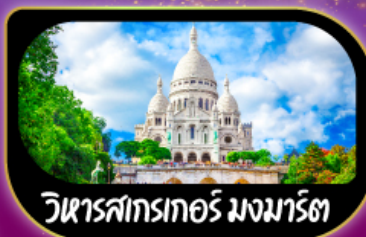
วิหารสกรเกอร์ มงมาร์ต