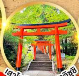
เสาโทริอิ ปราสาทอิซึชิ