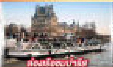
ชมเมืองบาเซิล