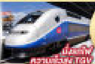
ขึ้นรถไฟ ความเร็วสูง TGV