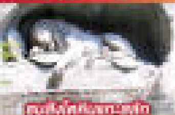
ชมฟาร์มโคนมสวิส