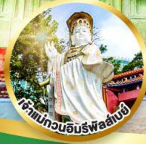
เจ้าแม่กวนอิมรัฟลัดโบย ขอพรรับพลังงานดี เสริมพลังดวงคู่