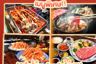
บุฟเฟ่ต์ญี่ปุ่น สเต็ก Kobe