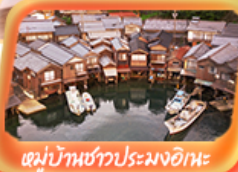
หมู่บ้านชาวประมงอิเะ