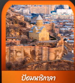
ป้อมนริกกาลา