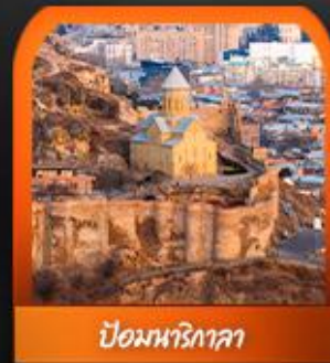
ป้อมนาริกาลา