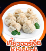
เกี้ยวจอร์เจีย Khinkali