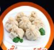
เกี้ยวจอร์เจีย Khinkali