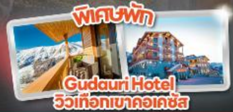
Gudauri Hotel วิวเทือกเขาคอเคซัส

Tbilisi Gudauri Borjomi Kazbegi Uplistsikhe