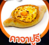
คาคาปุรี